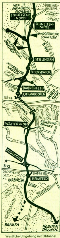
Westliche Umgehung mit Elbtunnel