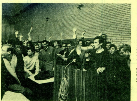
Meinungskampf mit Megaphonen: Studenten diskutieren im Hörsaal