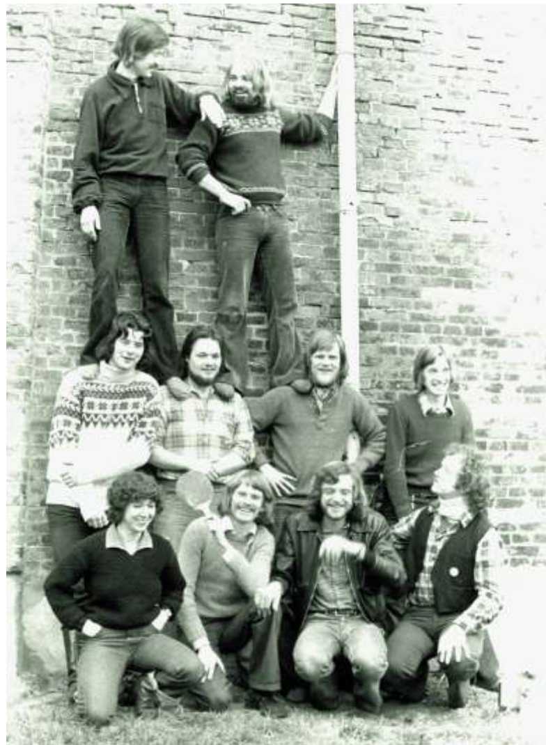
Foto: MPZ Aktivisten 1977

Aus einem Rückblick Anfang der 1980er Jahre: „Als 1973 das mpz gegründet wurde, war für seine Mitarbeiter der gemeinsame Ausgang- und Bezugspunkt zunächst das Studium an der Hochschule und die damalige Jugend-, Lehrlings- und Mieterbewegung. Unzufrieden mit der